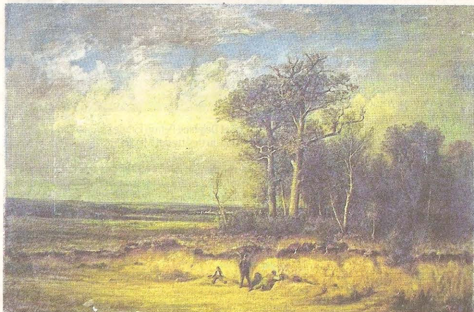
➔ Tableau « Les Fureteurs dans les carrières à cailloux de L'Isle-Adam », tableau réalisé en 1878, que possède le musée Thomas-Henry de Cherbourg.